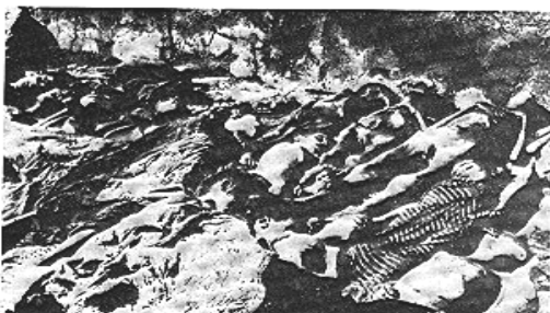
شماره ۲۰۰، ۱۹۱۷-۱۸