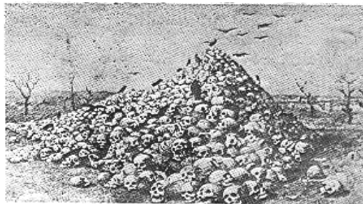
Հանգիստի տեղում, 1919 թ.

روز ۸ ماه مارس ۱۹۱۹ با فرمان مخصوص سلطان محمد ششم وحید الدین (۲۲-۱۹۱۸) رهبران حزب اتحاد و ترقی و وزرای آنان به دادگاه فوق العاده نظامی استامبول تحویل شدند. در جریان محاکمات ده نفر در غیاب و ۲۰ نفر شخصیت حزبی و حکومتی بطور علنی محاکمه شدند.