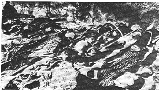
Հանգիստի տեղում, 1919 թ.