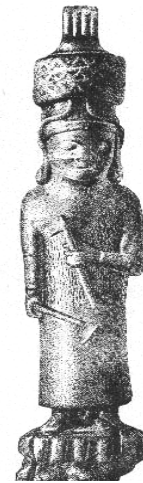
مجسمه برنزی نیشیا

اورویانی (آروپانی، نوارویانی، اروپانی) الهه اصلی پانتئون اورارتو و همسر خالدی بود. او تنها الهه ای است که نامش در سنگ نبشته ها ذکر شده است. نام او در مواقعی یاد شده که در باره سازندگی و ایجاد باغها صحبت به میان آمده باشد و به همین علت می توان تجسم کرد که او الهه میوه دهی و نیز حامی صنایع و پیشه ها بوده است. مرکز پرستش این الهه در اورارتو شهر خالدی یعنی آردینی بود.